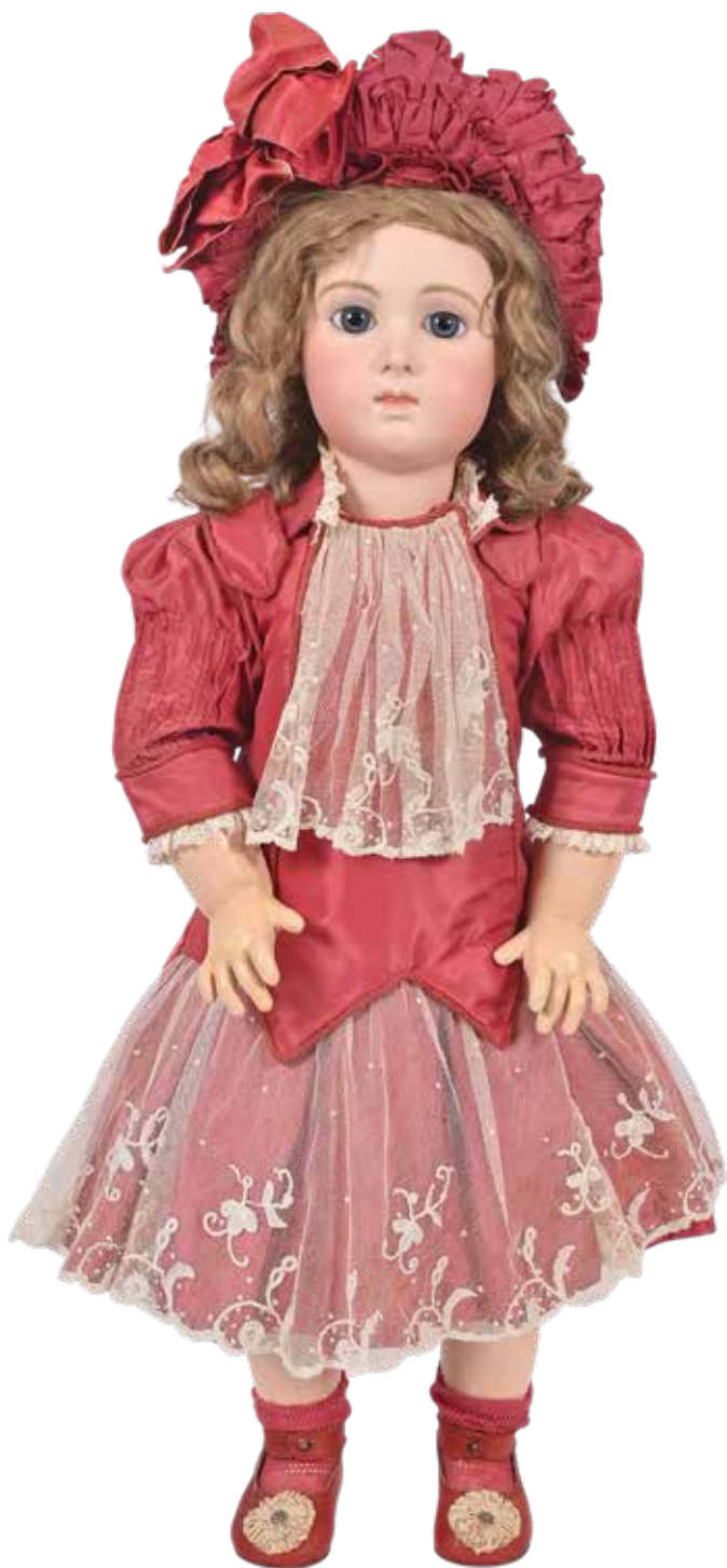
444 Jumeau Triste, Long Face, tête en biscuit pressé marqué en creux "14." bouche fermée, yeux de sulfure bleu, oreilles percées et rapportées, corps tout articulé à poignets fixes marqué au tampon bleu "Jumeau Médaille d'Or" (repeints), sous-vêtements, habits de style, chaussures à bride en cuir rouge ornées de rosaces de satin crème Bébé Jumeau taille 14. Dans une boîte Jumeau. 75 cm.