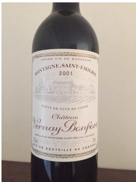
Lot n° 397