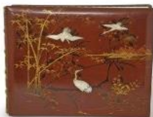
JAPON vers 1900 : Album en laque comprenant env. 50 photographes de scènes de la vie quotidienne, paysages etc... (Dim. des photos 25,5 x 20 cm)