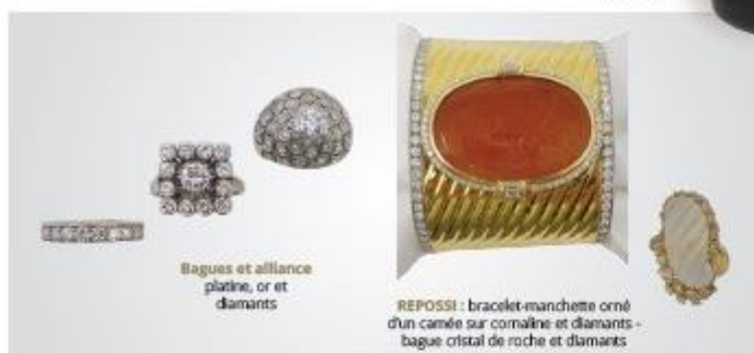
Bagues et alliance platine, or et diamants