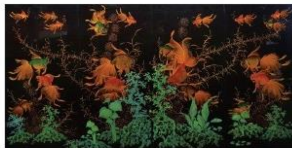
Quadrptyque en bois laqué - VIETNAM - fin XIX - 120 x 58 cm

Catalogue en ligne sur interencheres.com/30001 ou ivoire-france.com/nimes