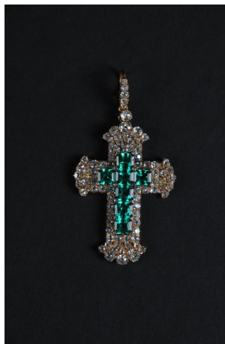
PENDENTIF croix épiscopale en or jaune 750 millièmes, ornée au centre de sept émeraudes rectangulaires à pans coupés dans un entourage de diamants de taille ancienne XIXème siècle. H. 8 - L. 4 cm - Poids brut : 18,8 g. Estimation 7.000 / 10 .000 €