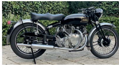
Vincent HRD 998 cm 3