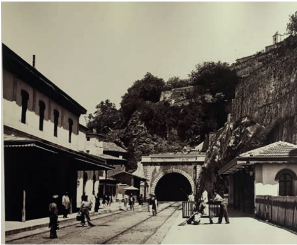
Planche 10 : Vienne sous-terrain 32x41,5.