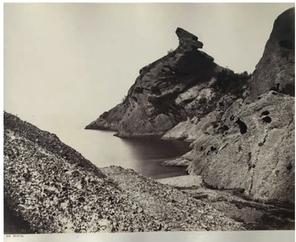
Planche 64 : Le Moine 33,5x43.