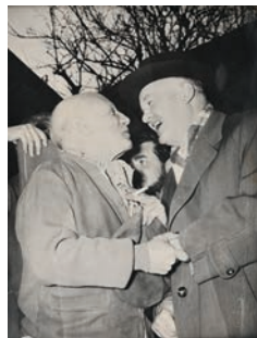
245 : Picasso et Thorez.